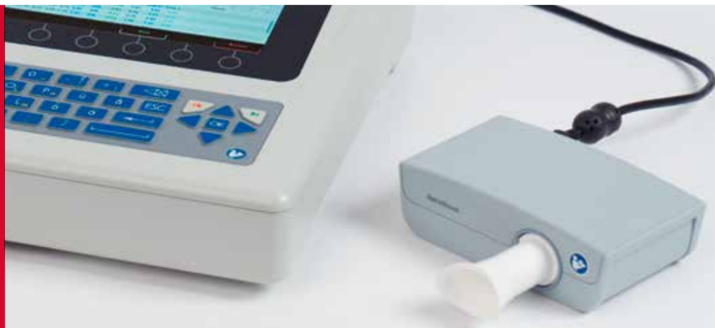
SpiroScout SP plus Spirometrieaufzeichnungen mit dem CARDIOVIT AT-102 G2