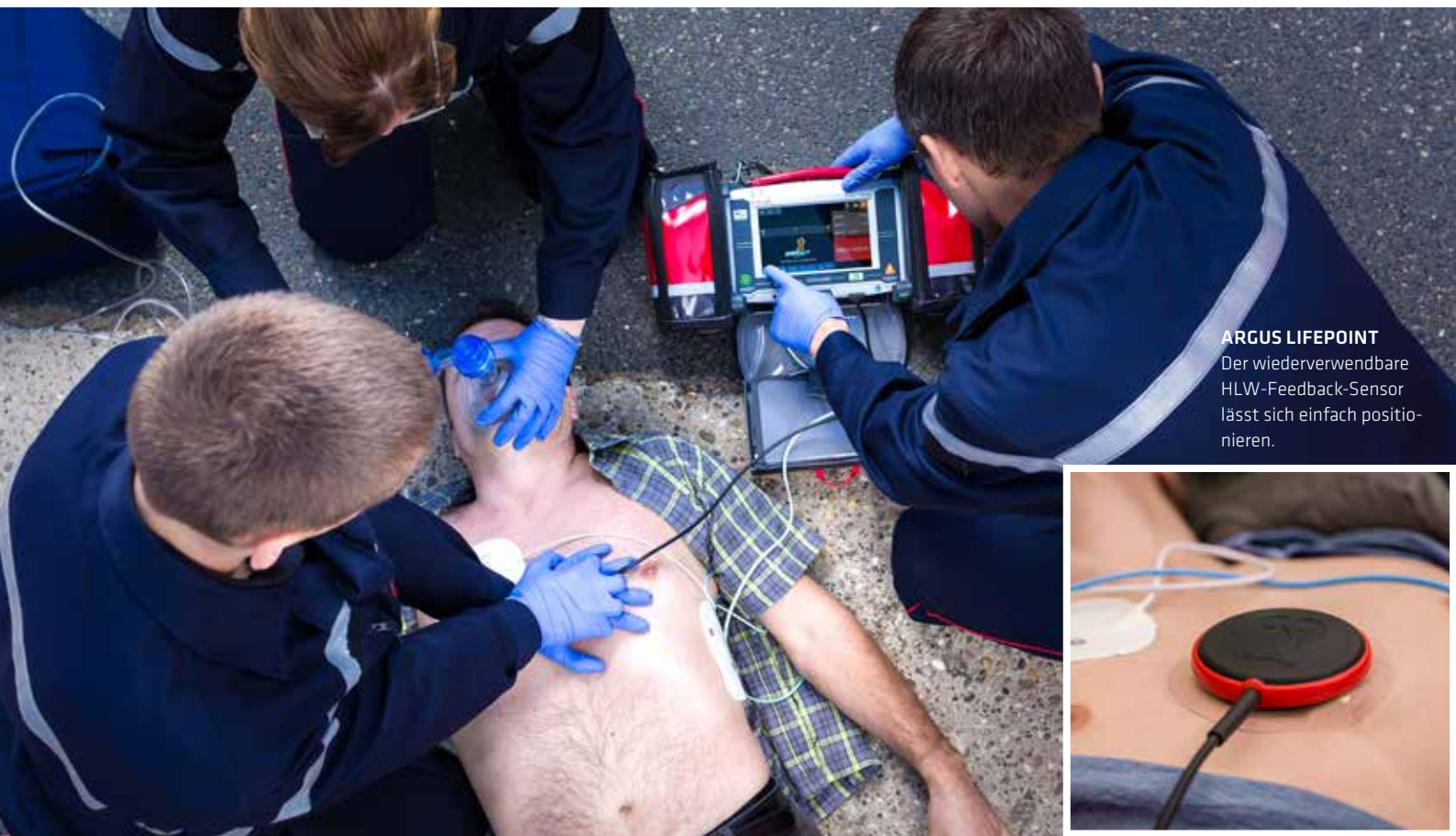
ARGUS LIFEPOINT Der wiederverwendbare HLW-Feedback-Sensor lässt sich einfach positionieren.